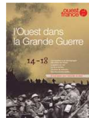
L'Ouest dans la Grande Guerre, hors-série Ouest-France 2004